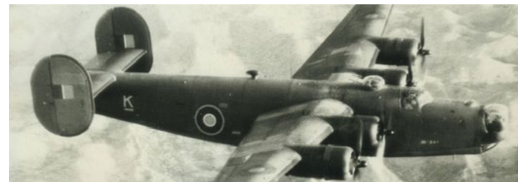
Fot. "Samolot B-24 Liberator z 31 Dywizjonu Bombowego SAAF w locie", pochodzi ze zbiorów Wojciecha Matusiaka.

zestrzelonych samolotów z okresu II wojny światowej i wyjaśnianiem losów ich załóg. Jest autorem wielu książek i artykułów, jak również wystaw w Muzeum Wojskiego Polskiego w Warszawie poświęconych tematyce lotniczej. Autor przez wiele lat zbierał materiały dotyczące zestrzelenia alianckiego samolotu nad Luborzycą. Zgromadzone materiały, w tym relacje mieszkańców Luborzycy i okolic, zostaną dzięki wydawnictwu udostępnione mieszkańcom nie tylko naszej gminy ale wszystkim pasjonatom historii. Równocześnie wydawnictwo stanie się kolejnym elementem budowy naszej lokalnej tożsamości historycznej.