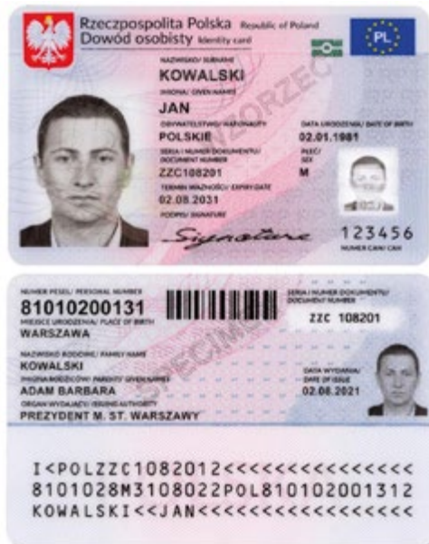
Wzór dowodu osobistego

Wymiana dowodu jest bezpłatna, niezależnie od powodu ubiegania się o nowy dowód osobisty.