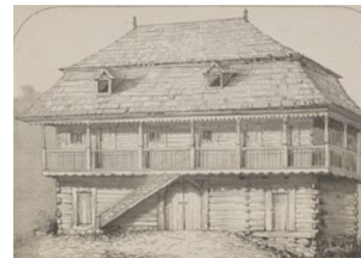
Spichlerz z wieku XVI, jedyny starożytny budynek drewniany, jaki był w pobliżu Krakowa, na podwórzu klasztoru p.p. norbertanek na Zwierzyńcu. | Obecnie (w r.1878) rozebrany i przeniesiony do wsi Luborzycy, w królestwie polskim.

Grafika zamieszczona była w Tygodniku Ilustrowanym z 1878 roku.