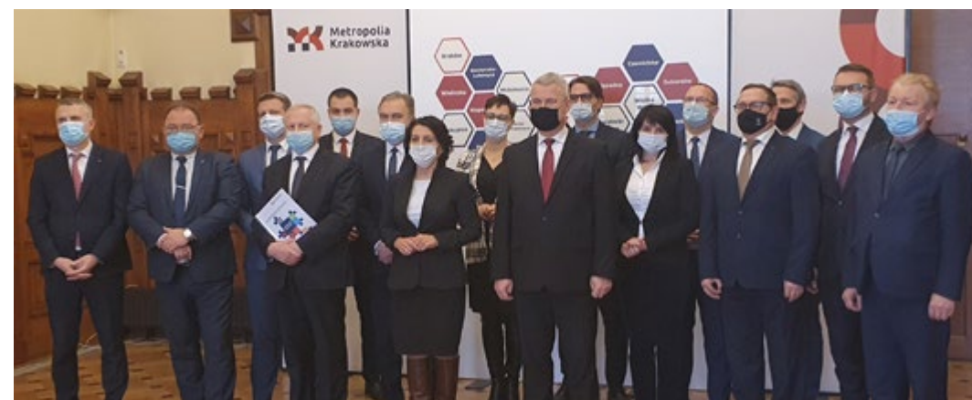
Tekst i zdjęcia: Stowarzyszenie Metropolia Krakowska